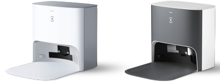
Esta imagen actúa exclusivamente como referencia y el color puede diferir del aspecto real del producto.

EN 301489-1 V2.2.3:2019 EN 301489-17 V3.2.4:2020 EN 55014-1:2017/A11:2020 EN 55014-2:2015 EN 61000-3-2:2014 EN IEC 61000-3-2:2019 EN 61000-3-3:2013 EN 61000-3-3:2013/A1:2019 EN 300328 V2.2.2:2019 EN 50665:2017 EN 60335-1:2012/A2:2019 EN 60335-2-2:2010/A1:2013 EN 60335-2-29:2004/A11:2018 EN 62233:2008 IEC 61558-1:2017 IEC 61558-2-16:2009 IEC 61558-2-16:2009/AMD1:2013